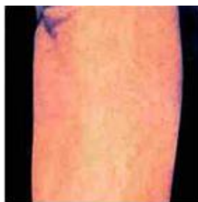
Po 3 týdnech.