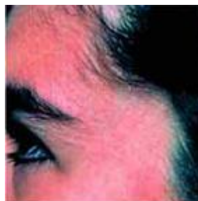
Po 3 týdnech.